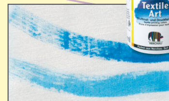
Textile Art zesvětlovač 830

Textile Art na tmavý textil 18 odstínů, á 59 ml obj.č.: 144... (+číslo odstínu)